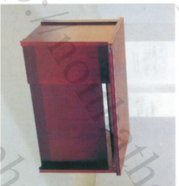
OD 1200A Bàn: W1200 * D700 * H760