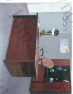
ET 1400A Bàn: W1400 * D700 * H760