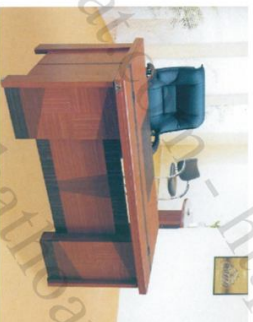
ET 1600F Bàn: W1600 * D800 * H760