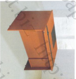
OD 1200B Bàn: W1200 * D700 * H760