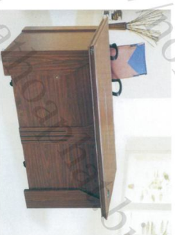
ET 1600M Bàn: W1600 * D900 * H760