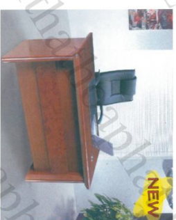
ET 1400G Bàn: W1400 * D700 * H760