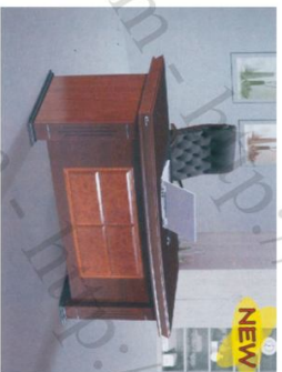
DT 1890H36 Bàn: W1800 * D900 * H760