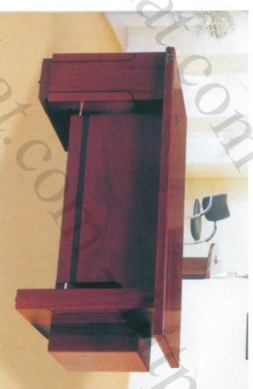
ET 1600T Bàn: W1600 * D600 * H760