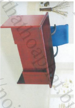
ET 1400C Bàn: W1400 * D700 * H760