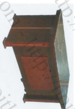
DT 1890H38 Bàn: W1600 * D800 * H760 Hộc di động: W420 * D300 * H620