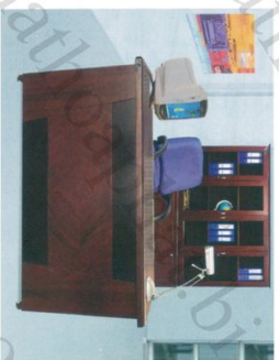
ET 1400B Bàn: W1400 * D700 * H760