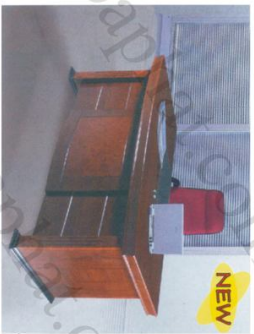
DT 1890H35 Bàn: W1800 * D900 * H760