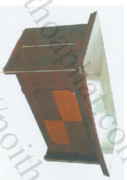
DT 1890H39 Bàn: W1900 * D900 * H760 Hộc di động: W420 * D300 * H620