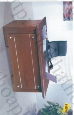
OD 1600E Bàn: W1800 * D900 * H760