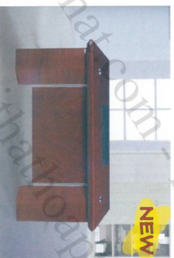
ET 1600H Bàn: W1600 * D800 * H760